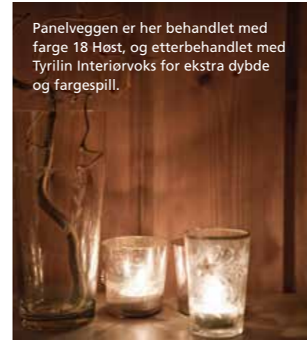
Panelveggen er her behandlet med farge 18 Høst, og etterbehandlet med Tyrilin Interiørvoks for ekstra dybde og fargespill.