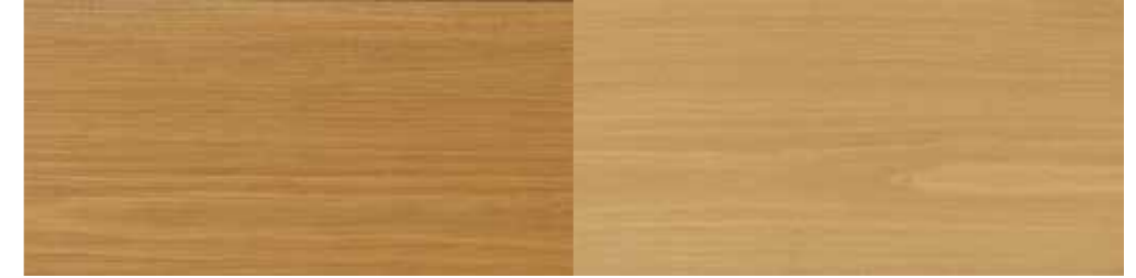
Tyrilin Interiørbeis 17 Stemning i ett strøk