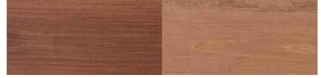
Tyrilin Interiørbeis 19 Bark i ett strøk