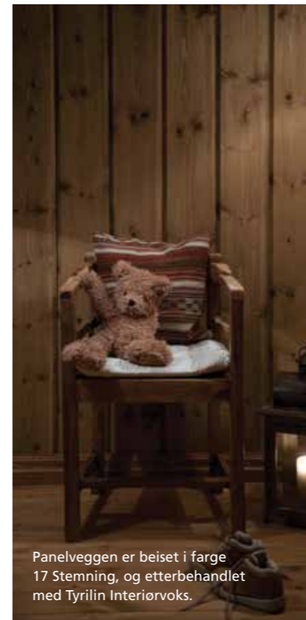
Panelveggen er beiset i farge 17 Stemning, og etterbehandlet med Tyrilin Interiørvoks.