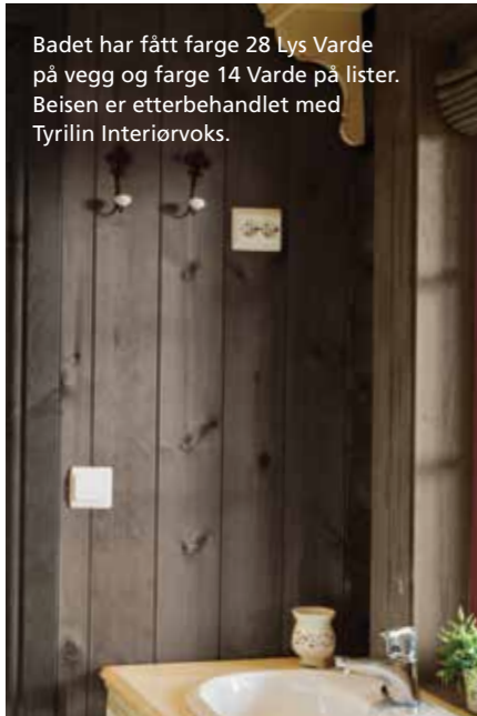
Badet har fått farge 28 Lys Varde på vegg og farge 14 Varde på lister. Beisen er etterbehandlet med Tyrilin Interiørvoks.