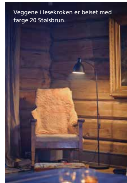
Veggene i lesestolen er beiset med farge 20 Stølsbrun.

NB! Lag prøveoppstrøk før påføring på vegg. Fargen vil variere avhengig av underlag og hvor mye beis som påføres.