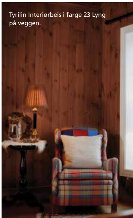
Tyrilin Interiørbeis i farge 23 Lyng på veggen.