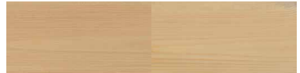
Tyrilin Interiørbeis 16 Morgenlød i ett strøk

NB! Lag prøveoppstrøk før påføring på vegg. Fargen vil variere avhengig av underlag og hvor mye beis som påføres.