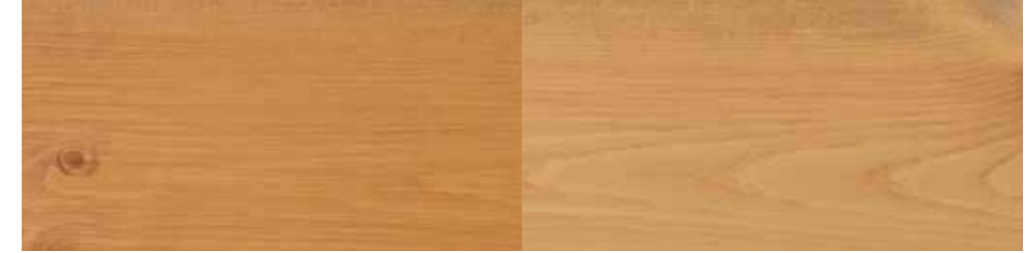
Tyrilin Interiørbeis 18 Høst i ett strøk