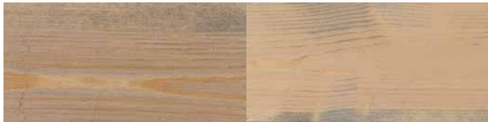
Tyrilin Interiørbeis 28 Lys Varde i ett strøk