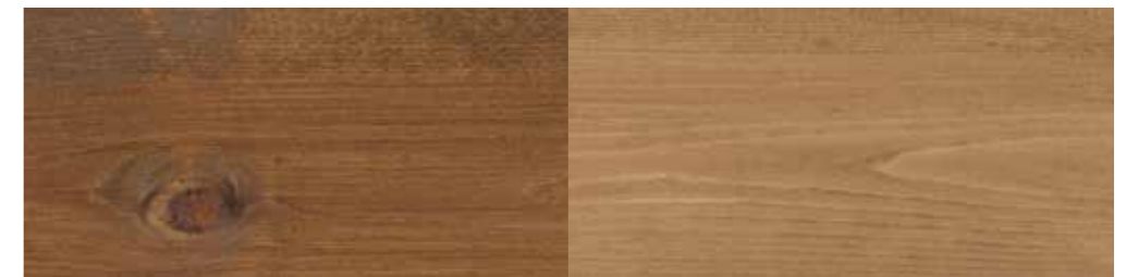
Tyrilin Interiørbeis 20 Stølsbrun i ett strøk