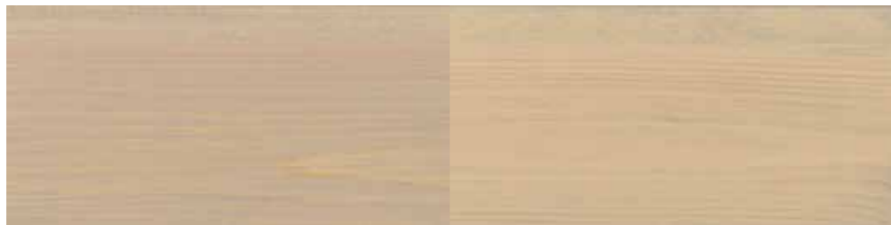
Tyrilin Interiørbeis 27 Lys Gråtonet i ett strøk