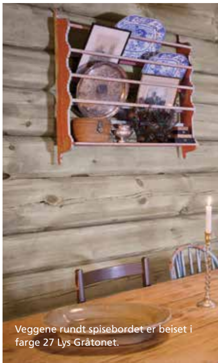
Veggene rundt spisebordet er beiset i farge 27 Lys Gråtonet.