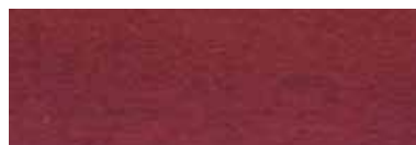
63 Mørk mahogni