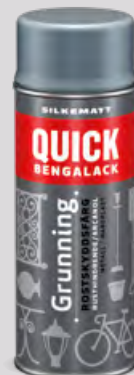
400 ml Spray