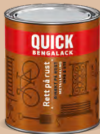
0,25l og 0,75l