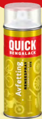
400 ml Spray