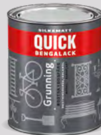
0,75l og 3l