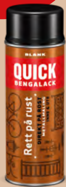
400 ml Spray