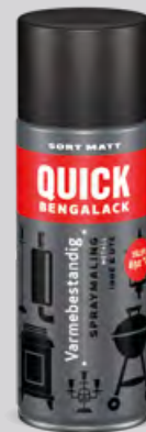
400 ml Spray

Quick Bengalack Varmebestandig Spray Malingen er perfekt for griller, eksosanlegg, gressklippere, ovner, peiser ol. Den tåler temperatur opp til 650 grader. Den er svært fargebestandig og holder seg godt over lang tid. Fargen er sort matt.